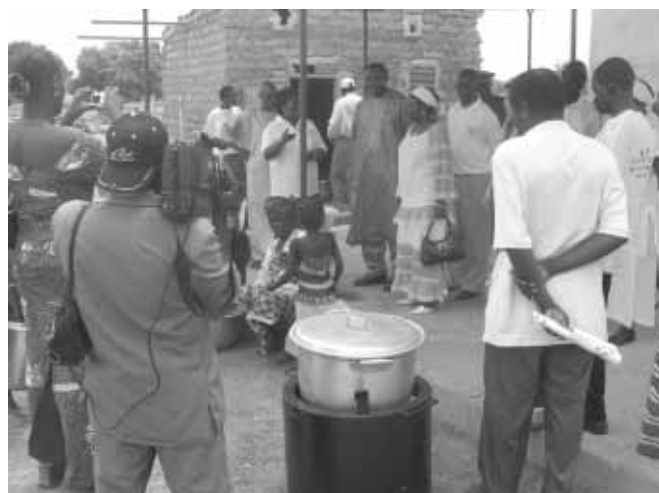
Visite du centre Karibio de Kosmassom