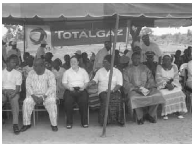
Nombreux étaient les invités qui sont venus pour soutenir les initiateurs de ce projet.