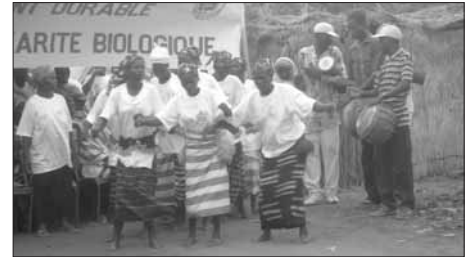
L'ambiance était au top à Boussé avec les prestations de la troupe Warba