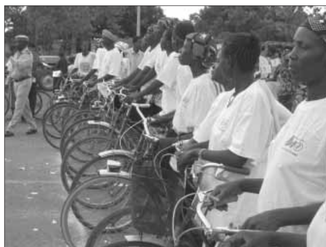
Les cyclistes attendant le coup de sifflet