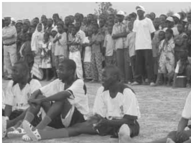
Les footballeurs de l'équipe de Ouidi